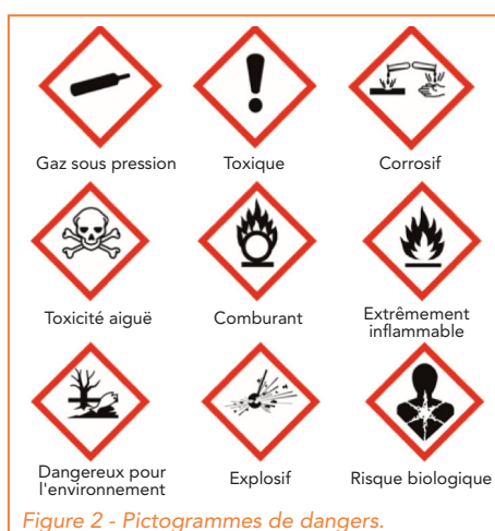
Figure 2 - Pictogrammes de dangers.

Les déchets peuvent contenir ces éléments chimiques et leurs composés compte tenu de leurs propriétés utiles ; le danger d'un déchet peut provenir de surcroît non seulement