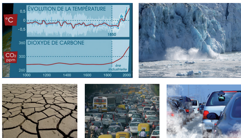
Figure 1. Changement climatique, embouteillage, dégradation de la qualité de l'air... l'industrie du transport de nos jours atteint ses limites.

L'Europe a été la première à chercher comment réduire les émissions de CO 2 , à partir du protocole de Kyoto.